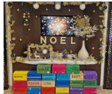
La résidence du Lac de Maine a remis des boîtes remplies de présents à 25 adolescents accueillis par l'association Marie Durand à Angers

Nous exprimons notre profonde gratitude à chaque résidence du Groupe Emera, aux collaborateurs, aux résidents et leur famille, ainsi qu'à tous ceux qui ont contribué à faire de cette collecte un succès.